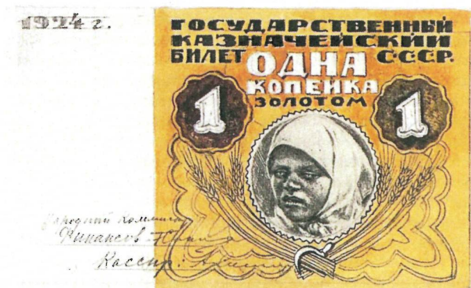
Я.Б. Дрейер Неосуществленный проект разменной боны номиналом в 1 копейку золотом. 1924 г. Собрание АО «Гознак».

женных женщин. Только на одном из вариантов они показаны на фоне фабричных труб, что позволяет думать, что это – молодые работницы.