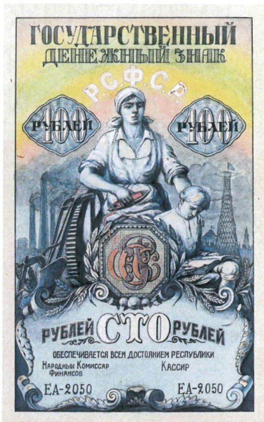
Д.С. Гаялкин. Неосуществленный проект государственного денежного знака РСФСР номиналом в 100 рублей. 1923 г. Собрание АО «Гознак».