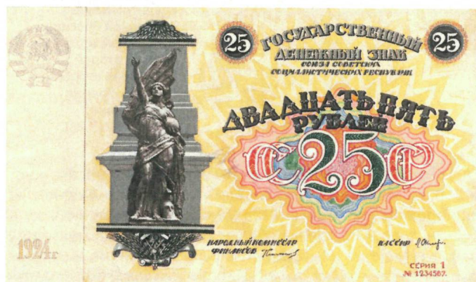
А.Г. Якимченко. Неосуществленный проект государственного денежного знака СССР номиналом в 25 рублей. 1924 г. Собрание АО «Гознак».