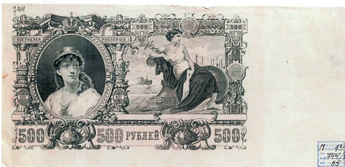
Государственный кредитный билет «Северной России» номиналом в 500 рублей. Выпуск второй. Обратная сторона. 1919 г. Собрание АО «Гознак».

лись ни разу, но неосуществленные эскизы таких банкнот сохранились в собрании Гознака. Некоторые изображения продолжали традицию использования аллегорических женских образов. Среди них можно отметить эскиз 1921 г. художника Генриха Шмидта. На нем изображена женщина в одежде, стилизованной под античную, с лавровым венком на голове и со свитком в руке – скорее всего, перед нами аллегорический образ Свободы. Такую же функцию – аллегии – выполняет женский образ на эскизе казначейского билета 1924 г., созданном Яном Дрейером. На нем изображена мужеподобная женщина, сидящая на возвышении. Она держит за руку ребенка, перед которым на огромном молоте лежит раскрытая книга – символ просвещения. Слева от женщины знамя – символ революции.