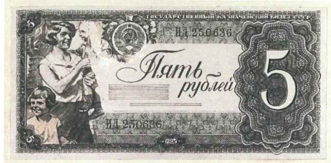
И.И. Дубасов Неосуществленные проекты государственного казначейского билета СССР номиналом в 5 рублей. 1936 г. Собрание АО «Гознак».