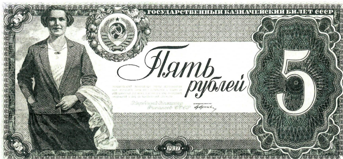
Пробный оттиск казначейского билета номиналом в 5 рублей с изображением женщины, не выпущенного в обращение. 1937 г. Собрание АО «Гознак».