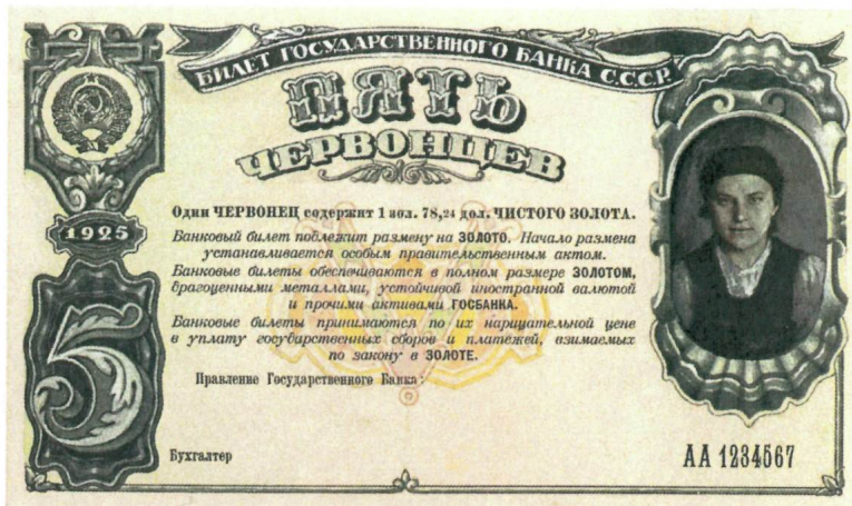
А.Г. Якимченко. Неосуществленный проект билета Госбанка СССР номиналом в 5 червонцев. 1925 г. Собрание АО «Гознак».