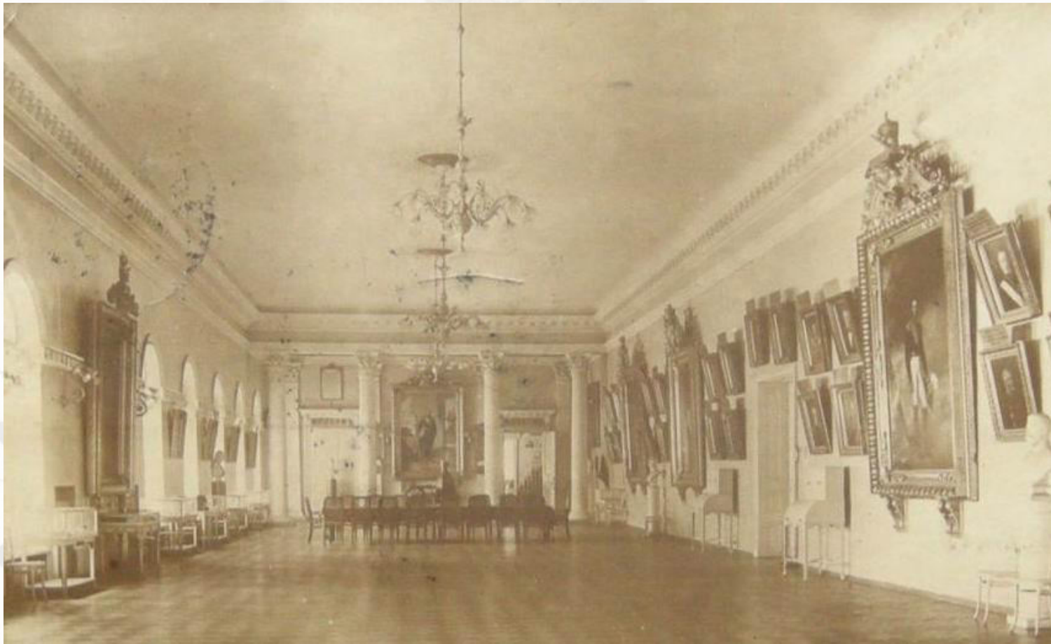
Илл. 6. Конференц-зал Горного института на старой открытке. Родословное древо вероятно располагалось в правом углу у колонны, за портретами императоров