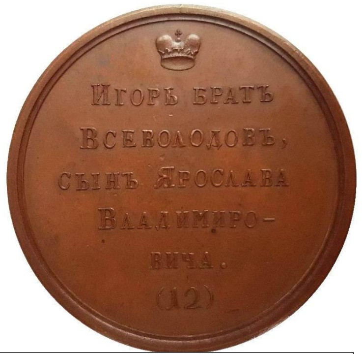
Илл. 3. Великий князь Игорь Ольгович. На реверсе ошибочная легенда

которые изготавливались в малом количестве и затем оседали в музеях, а также в частных собраниях знатных особ, где могли храниться долгое время. Увы, но даже упоминания, что были изготовлены золотые медали портретной серии, не говоря уже о самих медалях, мне неизвестны (современные копии-сувениры изготавливают из любого металла). Существовала коллекция, включавшая 61 серебряную медаль (от Рюрика до Павла I). Эти медали располагались на «родословном древе Русских Царей», которое находилось в Горном кадетском корпусе, одном из старейших учебных заведений России [16]. Сейчас оно экспонируется в Государственном Эрмитаже, недавно прошло реставрацию. К сожалению до нашего времени коллекция не дошла, медали были заменены тонкими односторонними оттисками из серебра. В Смитсоновском институте (США) находится 56 серебряных медалей серии из коллекции вел. кн. Георгия Михайловича, от Рюрика до Елизаветы.