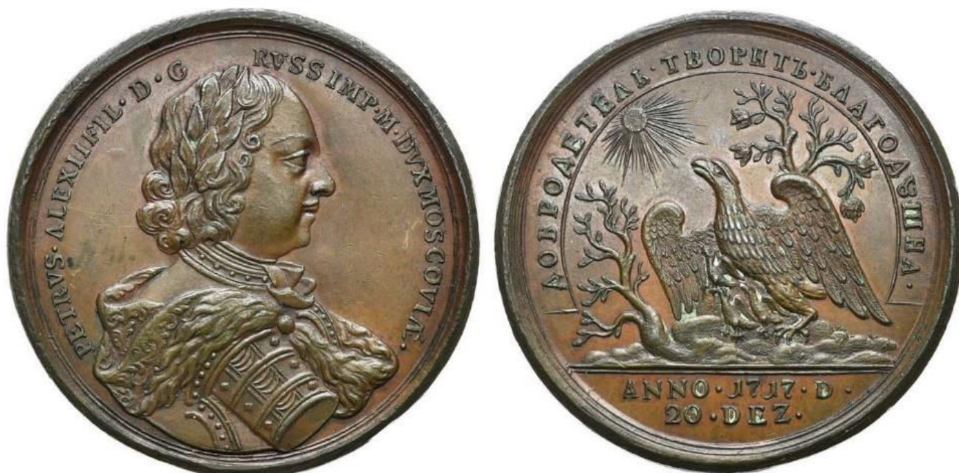
Илл. 13. Учреждение коллегий, копия с медали Калашникова, без подписи. Портрет скопирован с варианта Климова.

Изготовление коронационных медалей разных размеров стало традицией начиная с коронации императрицы Анны. По случаю коронации Елизаветы Петровны 25 апреля 1742 года на это событие была отчеканена медаль тремя штемпелями с одинаковым изображением, но разного размера: большого, среднего