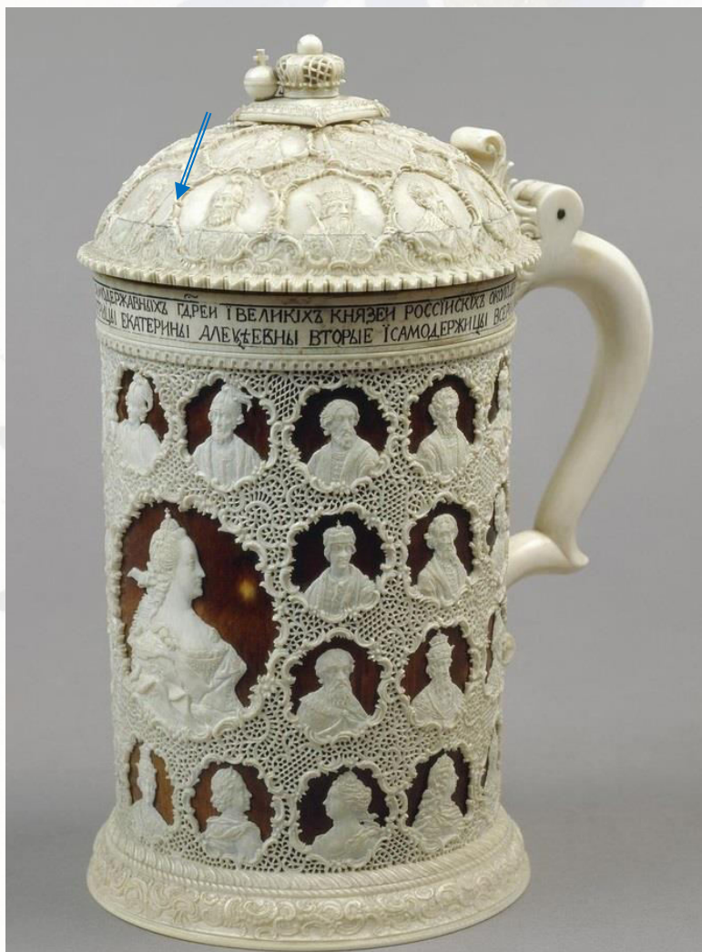
Илл. 2. Дудин О.Х. Кружка, резная кость. Государственный Эрмитаж. ⇒ Одна медаль (Дьяков №1615А) отсутствует.

Однако известные старые подборки от Рюрика до Елизаветы содержат 58 медалей. Противоречия в этом нет, поскольку через несколько лет после того, как серия была отчеканена, к ней добавилась ещё одна медаль - великого князя Игоря Ярославича (Дьяков №1615А). Изображение, взятое с этой медали, приведено в «Истории России» Н.Г.Леклерка 1783 года, изданной в Париже [24]. Получается, что медаль была добавлена между 1776 и 1783 годами. Здесь кроется одна загадка, не имеющая пока внятного объяснения. Дело в том, что Игорь Ярославич никогда не был великим князем Киевским. На медали должно было стоять имя