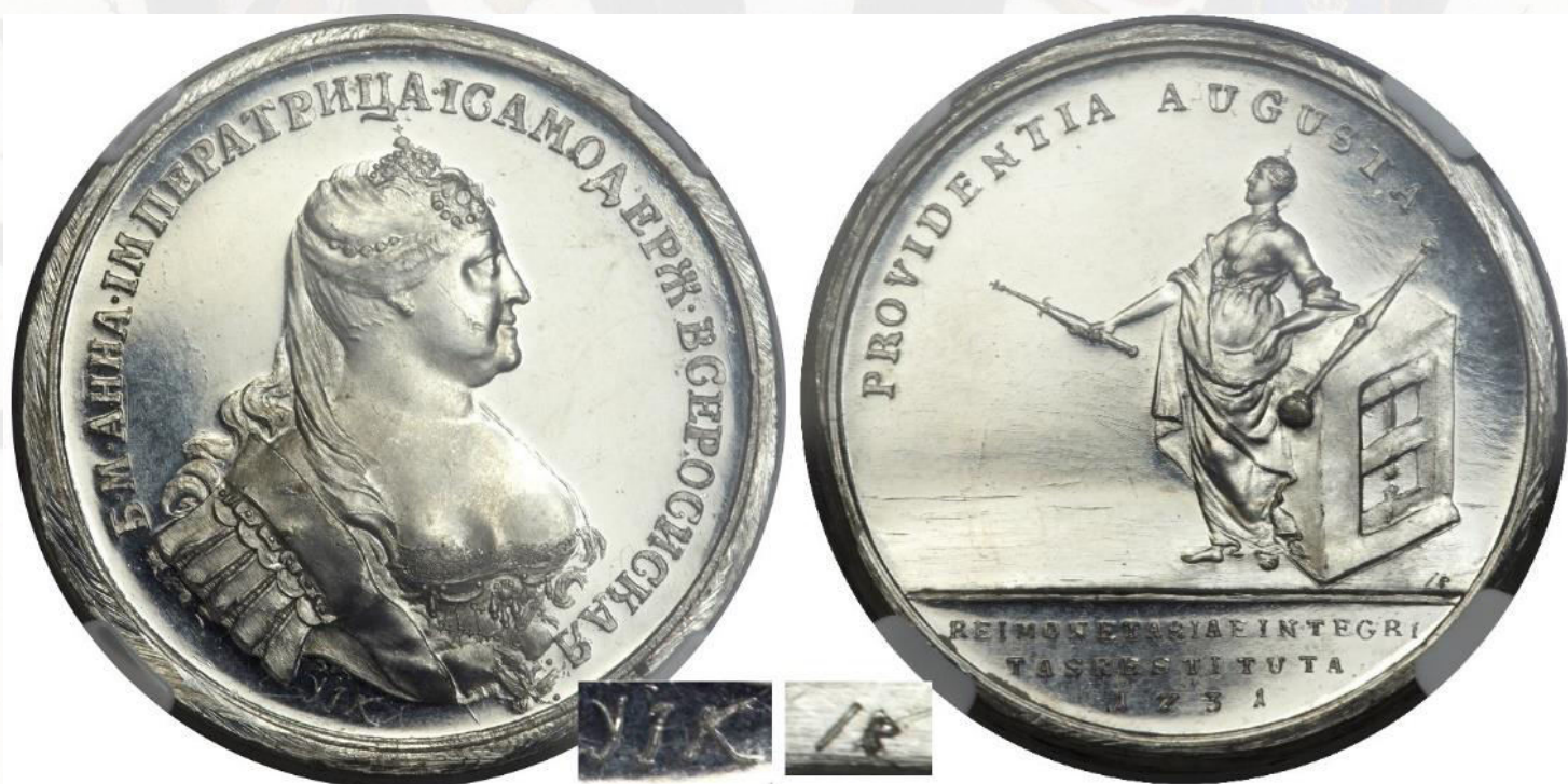
Илл. 19. Реформа монетного дела, копия с медали неизвестного автора. Автор аверса "УК", реверса "К".