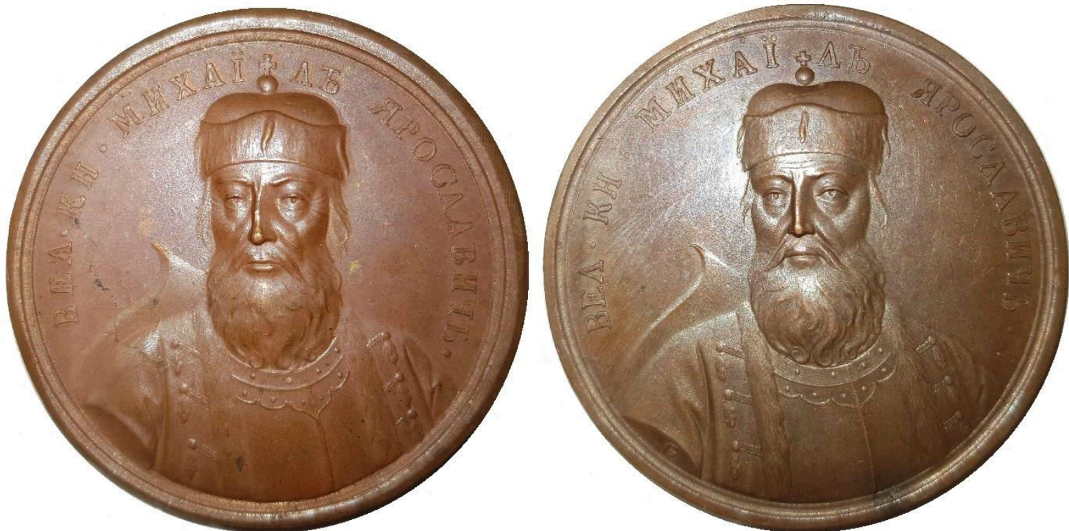
Илл. 8. Слева - вариант без подписи медальера, справа - с монограммой "G"

круговой надписи. Подчеркну, штемпели всех пяти медалей из правого столбца таблицы отличаются от варианта с «G», речь не идет о стёртой монограмме на ветхом штемпеле.