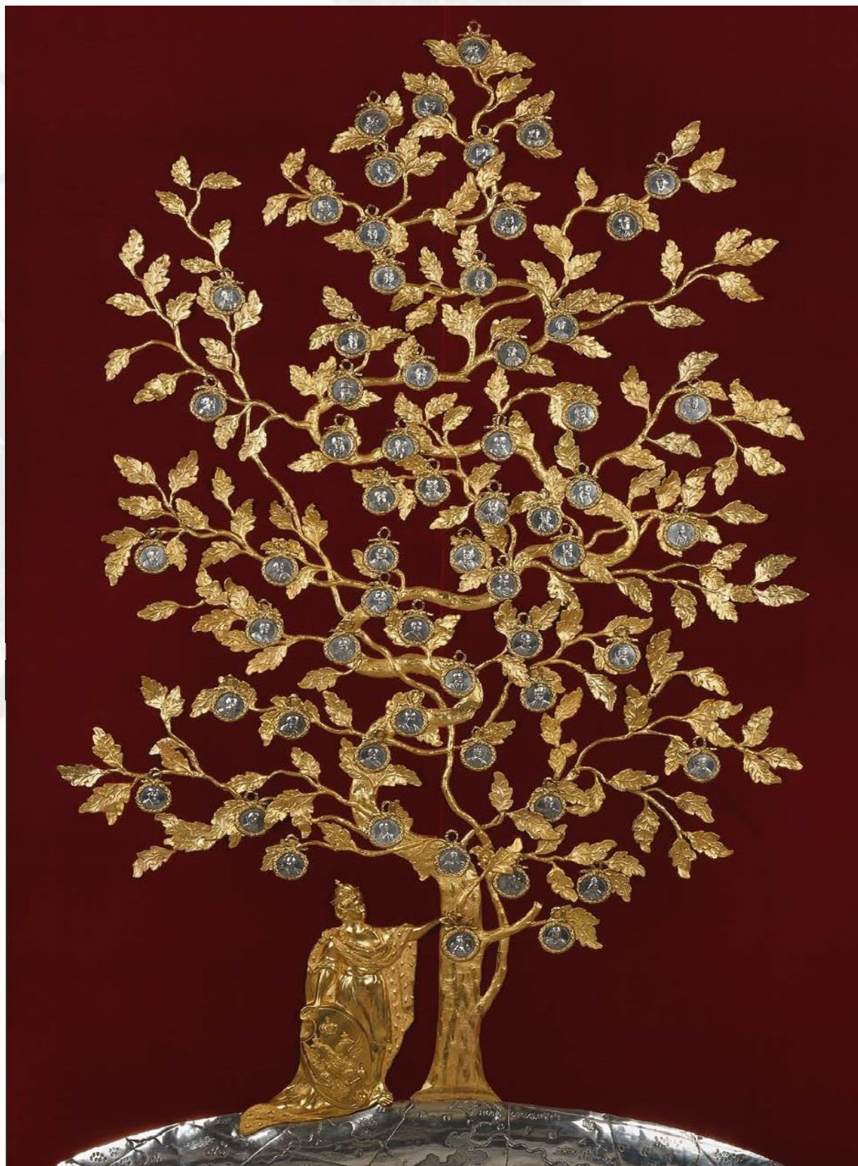
Илл. 5. Родословное древо государей российских. Государственный Эрмитаж

Подборка старая, но состояние медалей заставляет усомниться, что они отчеканены в числе первых оригинальными штемпелями.