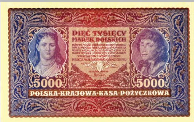
Ил. 7. Банкнота достоинством 100 марок (210×128 мм) (1919 г.) и кредитный билет достоинством 5000 марок (225×140 мм) (1920 г.) государственной кредитной кассы, выпущенные Польской Республикой.

Весь 1918 год был насыщен такими событиями, что в результате произошли весьма значительные изменения в международном положении. Это — революции в Австро-Венгрии, Германии, затем — аннулирование соглашений Брестского мира. Политические события в соседней Украине неожиданно затронули и белорусские земли. В политико-административный организм Беларуси был внесен вирус "географического беспредела". Только так можно диагностировать течение событий того времени. В некоторых белорусских городах наступило иное административное управление в лице Украинской Центральной Рады и вместе с ней введение в обращение еще одного вида денежных знаков — украинских карбованцев.