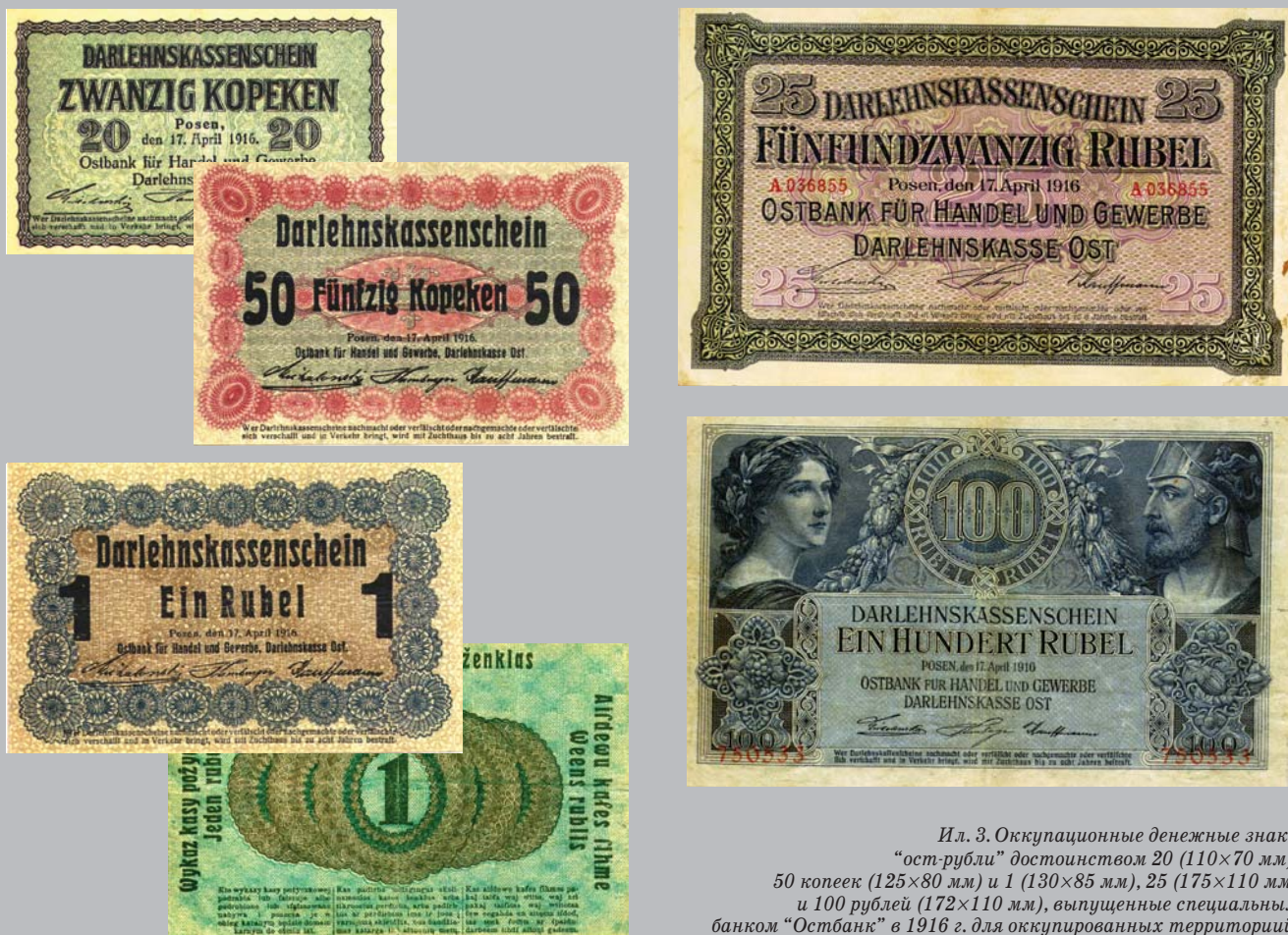
Ил. 3. Оккупационные денежные знаки "ост-рубли" достоинством 20 (110×70 мм), 50 копеек (125×80 мм) и 1 (130×85 мм), 25 (175×110 мм) и 100 рублей (172×110 мм), выпущенные специальным банком "Остбанк" в 1916 г. для оккупированных территорий.

ключення міру на ўсходзе і асабіста ў абласцях, занятых немцамі і відочна йдуць да радаснаго для нас развіцця, у якім, звычайна, заінтэрасаваны ўсе ўчаснікі. У першай лініі расвітаючай прамысловай чыннасці праглядае агульнае, прынятае шчыра, жаданне залечыць балячкі, зробленыя вайною і вазраціць народы да пладатворнай культурнай работы ў спакойнай абстаноўцы. Свае ўспешнае развіццё гэтае жаданне знаходзіць ва Усходняй Ссуднай Касе, якая адчыніла свае аддзяленні ва ўсіх велькіх гарадах вобласцеў, якія Немеччына вярнула да спакойнай работы, як напрыклад: Рэвель, Рыга, Вільня, Горадзен, Беласток, а таксама тут, у Менску (на Саборным плацу, 4).