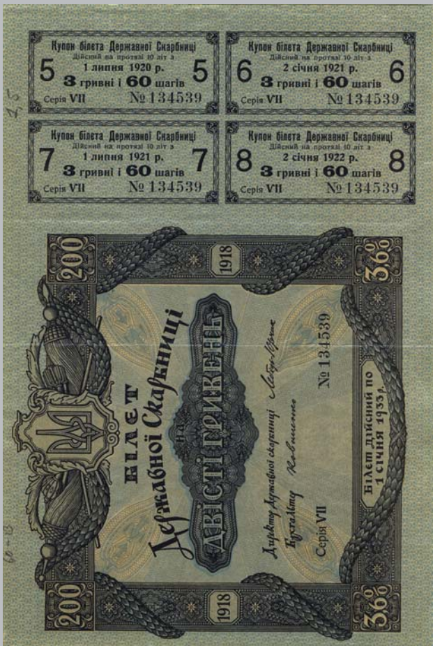
Ил. 10. 3,6%-ные облигации внутреннего займа 1918 г. (150×220 мм), отпечатанные в Германии по заказу Центральной Рады Украины. Печатались вместе с купонами.

ной Радой в Германии, была получена в Украине 17 октября 1918 года правительством гетмана Скоропадского. На лицевой стороне еще значилась надпись: Украинская Народная Республика. На более крупных номиналах, т.е. 1000 и 2000 гривен, изготовленных также в Германии, но по заказу правительства гетмана Скоропадского, уже была надпись: Украинская Держава. Следует отметить, что это был последний денежный заказ гетмана Скоропадского. До его падения оставалось 59 дней.