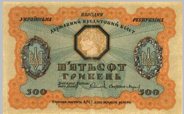
Ил. 11. Кредитные билеты номиналами 2 (110×70 мм), 10 (140×90 мм), 100 (175×115 мм), 500 гривен (185×120 мм) выпуска 1918 г.