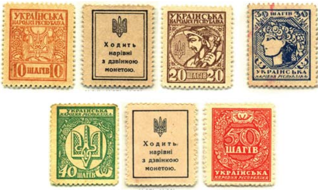
Ил. 9. Серия украинских разменных знаков — “шагов” (25×31 мм), выпущенная 18 апреля 1918 г.

100 шагов = 1/2 карбованца). Облигации печатались с купонами (8 штук), которые затем также стали использоваться в качестве денежных знаков по обозначенному на них достоинству (ил. 10).