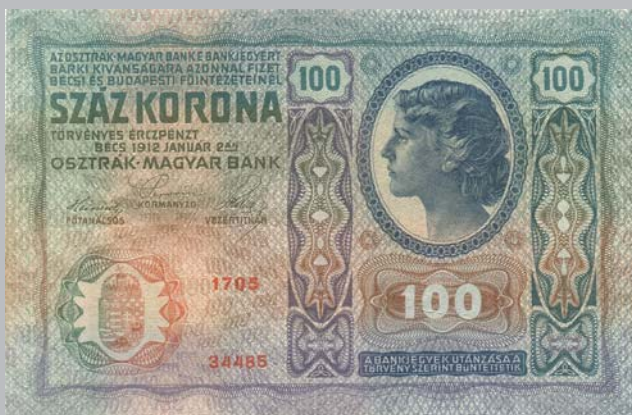
Ил. 2. Австро-венгерские денежные знаки достоинством 1 (115×70 мм), 2 (115×85 мм), 100 крон (165×110 мм), имевшие обращение на территории Беларуси.