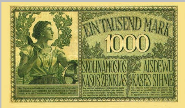
Ил. 5. Оккупационные денежные знаки “ост-марки” достоинством 1000 марок (180×100 мм), выпущенные специальным банком “Остбанк” в 1918 г. для оккупированных территорий.

1) фактически этот курс населением не признается; 2) крестьяне, в руках которых находятся предметы продовольствия, совершенно не принимают ост-рублей, а это ставит городское население, в частности служащих в разных учреждениях, получающих жалованье “остом”, в безвыходное положение. Поэтому представляется необходимым приравнение ост-рубля и марки”. Газета “МИНСКИЙ ГОЛОС” от 22 ноября 1918 года, в свою очередь, сообщает: