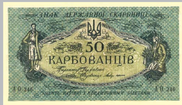
Ил. 8. Денежные знаки государственного казначейства номиналом 50 карбованцев (135×75 мм), выпущенные в 1918 г. Украинской Народной Республикой.