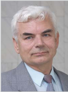
Председатель клуба "Поиск" Белорусского общественного объединения коллекционеров

После первого раздела Речи Посполитой (1772 г.), в результате которого Беларусь оказалась в составе Российской империи, на ее территории появились только что выпущенные в обращение (1769 г.) первые бумажные денежные знаки — ассигнации с номиналами купюр в 25, 50, 75 и 100 рублей. Бумажно-денежные эмиссии "понравившись" государству, а потому вскоре за первым выпуском последовали новые и новые, периодически меняясь в выпусках как номиналами купюр, так и их дизайном. С тех пор бумажные денежные знаки стали основным видом обращения государственных финансов. Однако известны и периоды потрясений основ денежного обращения.