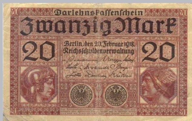
Ил. 1. Денежные знаки Германии достоинством 1 (96×60 мм) и 2 (112×70 мм) марки выпуска 1914 г., а также 5 марок 1917 г. (127×80 мм) и 20 марок 1918 г. (143×90 мм), имевшие обращение на территории Беларуси.

Дальнейшее распространение оккупационных денежных знаков на территории Беларуси и хаотические колебания обменного курса между ними можно проиллюстрировать материалами из сохранившейся хроники в средствах массовой информации Беларуси.