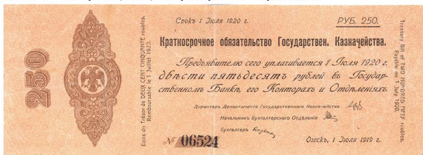
Рис. 2 Вид серии Б/С(без серии), Тип 3