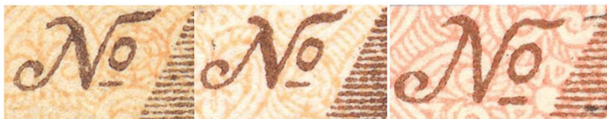
Рис. 5. Различные варианты знака «№» : Бл1, Бл2, Бл3

Во-вторых , это текстовая информация, которая наносилась на готовый Бланк . Цвет