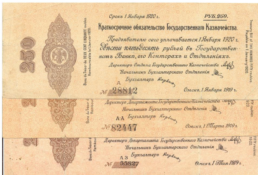
Рис. 1. Начальные серии для трёх Видов серии: А 28812 – Вид серии Х , Тип 1, литера серии “А” одного цвета с картушем А-А 82447 – Вид серии Х-Х , Тип 2, литеры серии “А-А” чёрного цвета АЗ 55827 – Вид серии ХХ , Тип 2, литеры серии “АЗ” чёрного цвета