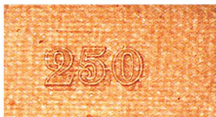
Рис.3. Бумага типа «верже», 250р. Май, серия А-Д