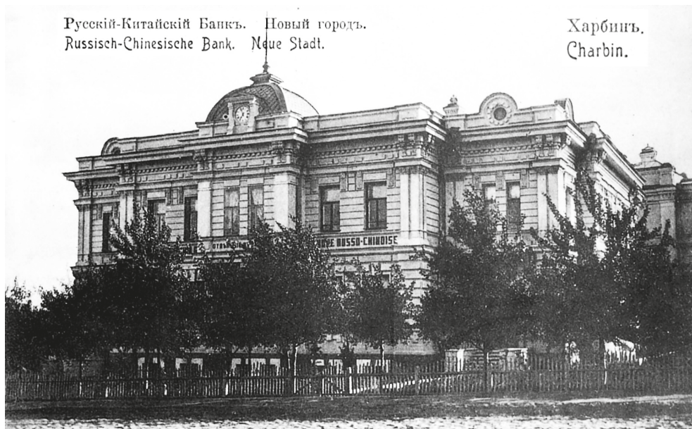
Здание Русско-Азиатского банка в Харбине, почтовая открытка